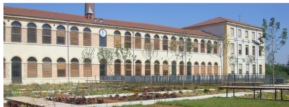
Le lieu d'exercice de la fonction est situé à la Cartoucherie de Bourg-lès-Valence (26).

VOTRE LETTRE DE MOTIVATION ET VOTRE CV SONT À ADRESSER :